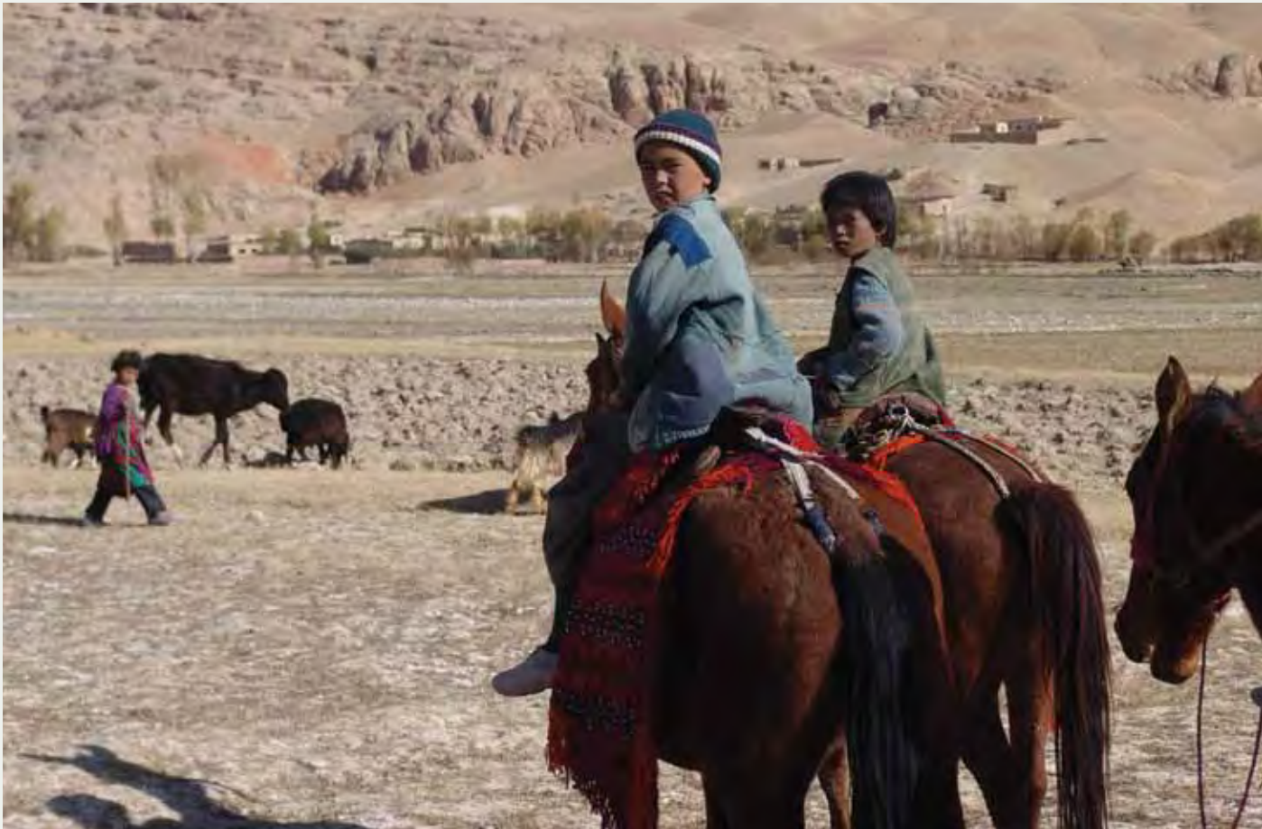
Légende : Jeunes gardiens de troupeaux dans la vallée de Yakawlang, province de Bamyan, Afghanistan.