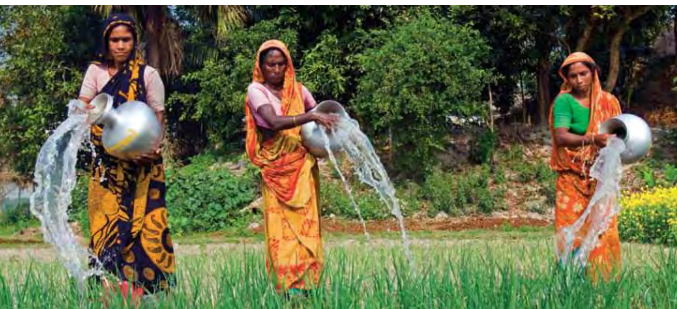
Paysannes irriguant un champ au Bangladesh.

La nécessité d'articuler les initiatives de renforcement des capacités pour un environnement durable à des stratégies en faveur de l'égalité des sexes fait l'objet d'un consensus croissant. Les femmes occupent une place essentielle dans la gestion des ressources environnementales et naturelles, notamment à travers le ravitaillement en eau et en bois de chauffage, ou la gestion de petites exploitations agricoles et des ressources forestières. La Stratégie du PNUD pour la promotion de l'égalité des sexes affirme son engagement en faveur du « développement des compétences afin d'assurer la pleine prise en compte des dimensions de l'environnement et de l'énergie liées à l'égalité des sexes dans les politiques, stratégies et programmes nationaux. » 14 Cela implique, dans le domaine du renforcement des capacités pour un environnement durable, d'utiliser les instruments d'analyse de l'égalité des sexes du PNUD, dont l'efficacité n'est plus à prouver pour promouvoir l'égalité des chances entre les hommes et les femmes en matière d'accès et de contrôle des ressources environnementales et de participation pleine et entière à la prise de décisions relatives à la durabilité environnementale.