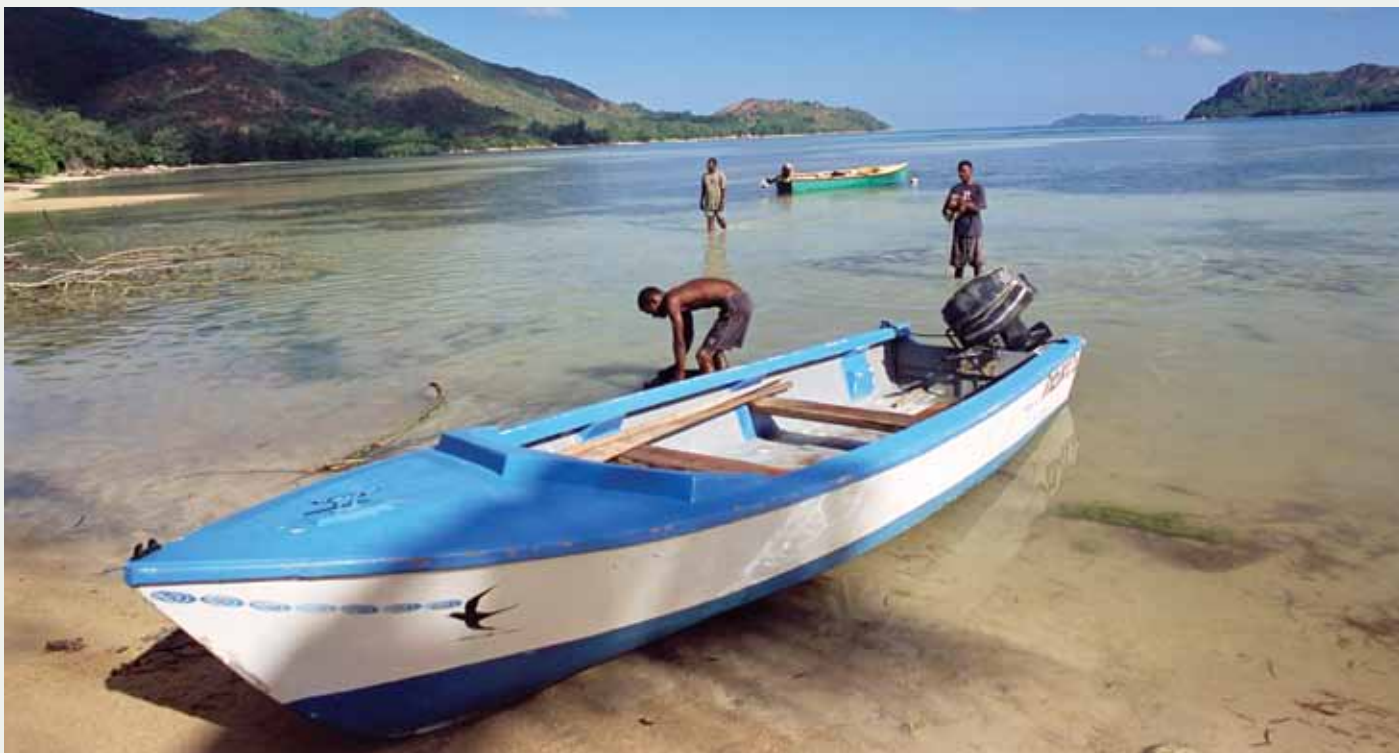
Grand'Anse, côte sud, île de Praslin, Seychelles, océan Indien, Afrique.

(Toutes les citations sont de Hunnan et Piest, 2006. Emerging Lessons)