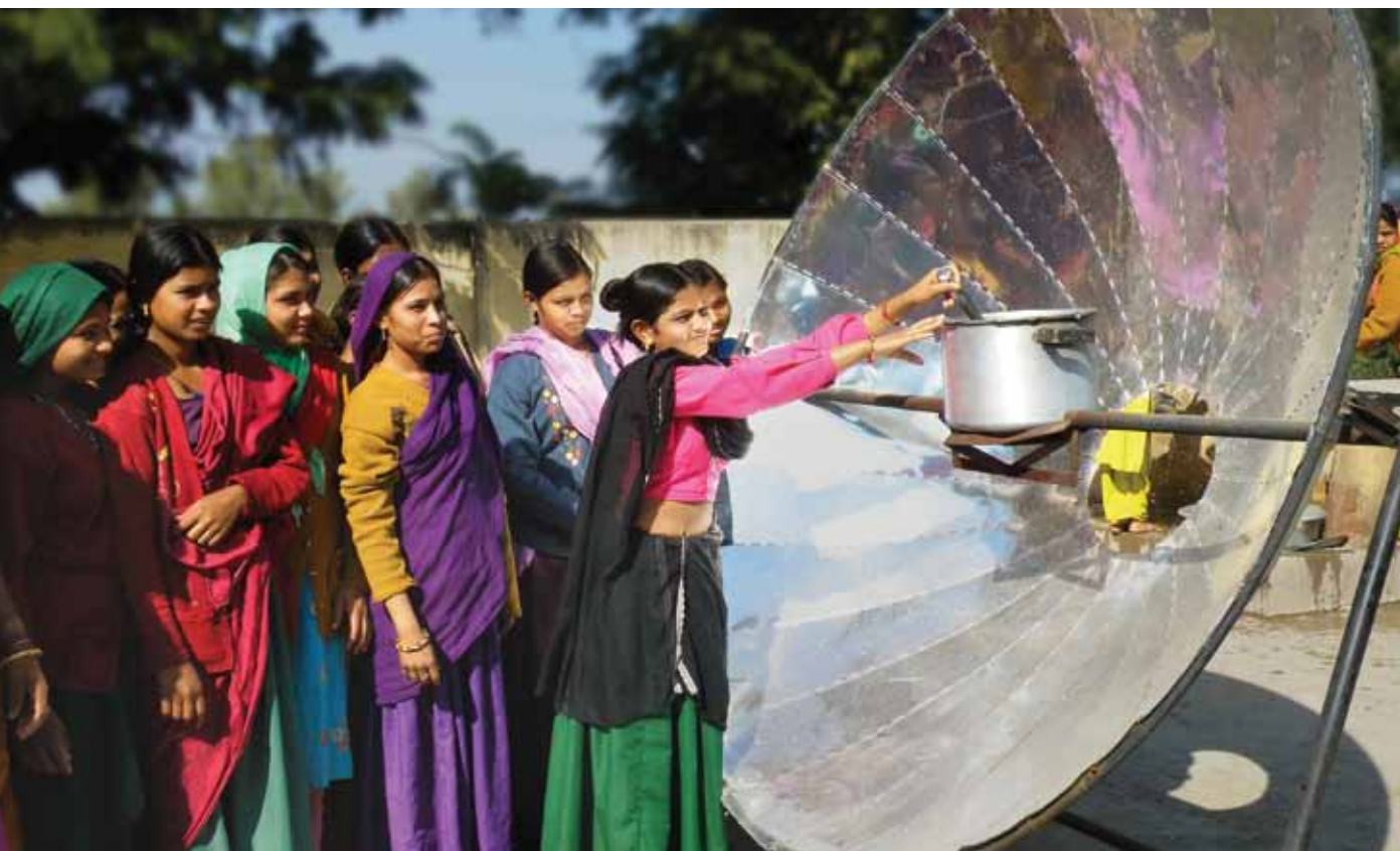
Groupe de jeunes femmes indiennes apprenant à utiliser un cuiseur solaire parabolique.