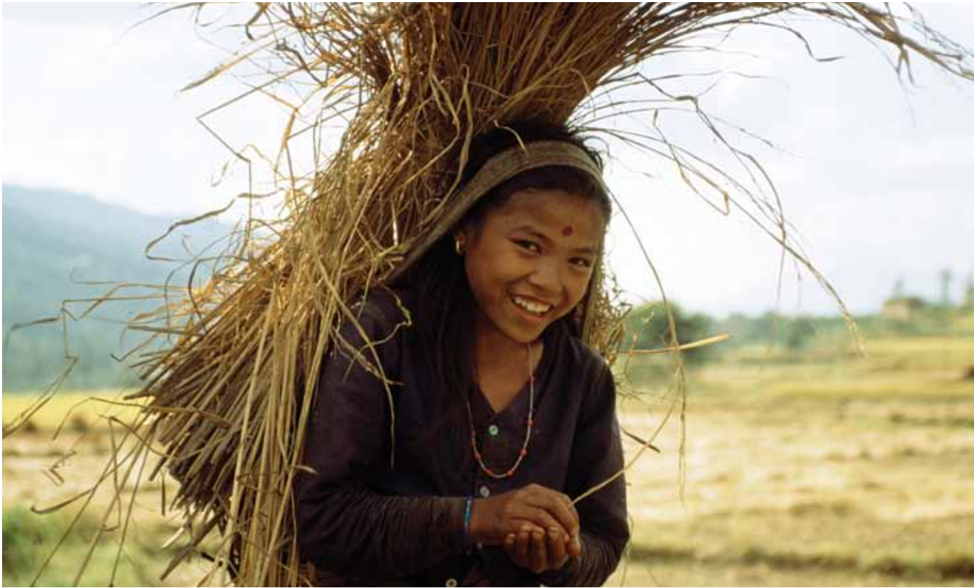
Jeune femme tenant une gerbe de riz, Népal, vallée de Katmandou, village de Sankhu.

Le cadre analytique du PNUD en matière de renforcement des capacités pour un environnement durable prend en compte trois niveaux de capacités : les individus, l'organisation et l'environnement propice (ou « niveau du système »), qui englobe les systèmes politique, social, économique, juridique et réglementaire au sein desquels opèrent les organisations et les individus. Ce cadre identifie également des capacités essentielles pouvant être renforcées en vue de la réalisation d'objectifs spécifiques de durabilité environnementale. Celles-ci incluent les capacités fonctionnelles nécessaires pour remplir les principales fonctions liées à la mise en œuvre des initiatives de renforcement des capacités pour un environnement durable, notamment des capacités à :