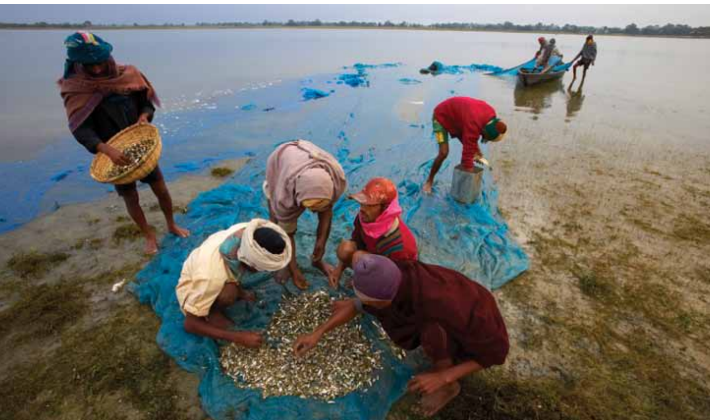
Pêcheurs remontant un filet à mailles fines au bord du fleuve Brahmapoutre. Sous-continent indien, Inde, Assam, Tezpur.

Pour soutenir la réalisation de l'objectif de « renforcement des capacités nationales en vue d'intégrer les préoccupations en matière d'environnement et d'énergie dans les plans de développement nationaux et leurs systèmes de mise en œuvre » énoncé dans le plan stratégique du PNUD, il convient d'adopter une approche institutionnelle claire dans le domaine du renforcement des capacités pour un environnement durable, fondée sur les notes pratiques sur le renforcement [ Capacity Development Practice Note (2008a) ] et l'évaluation des capacités [ Capacity Assessment Practice Note (2008b) ]. 15 Cette section présente un cadre analytique et une approche du renforcement des capacités pour un environnement durable qui s'articule autour de dix principes directeurs, de trois niveaux de capacités – chacun doté de différents points d'entrée –, de 17 capacités environnementales et de quatre thèmes fondamentaux. La Section 3 présente une procédure en cinq étapes pour renforcer les capacités pour un environnement durable et l'Annexe A fournit des outils pratiques de programmation pour la mettre en œuvre. Cette approche et ces outils pourront être librement adaptés en fonction du contexte, des délais, des ressources et des conditions.